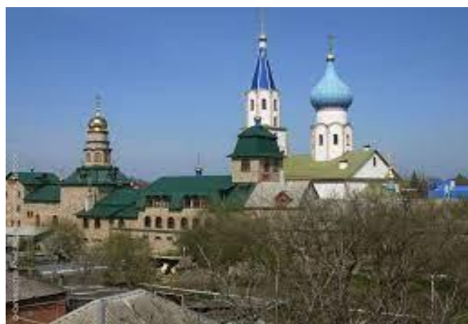
Рисунок 8. Свято-Духов мужской монастырь Тимашевска

В мае 2021 года точный список чудотворной иконы Божией Матери «Троеручица» прибыл в Краснодар со святой горы Афон. Его выполнили монахи с образа, который находится в монастыре Хиландаре. Икону освятил и приложил к чудотворному образу игумен Хиландара архимандрит Мефодий. Святыня передана в Свято-Духов мужской монастырь Тимашевска (рисунок 8).