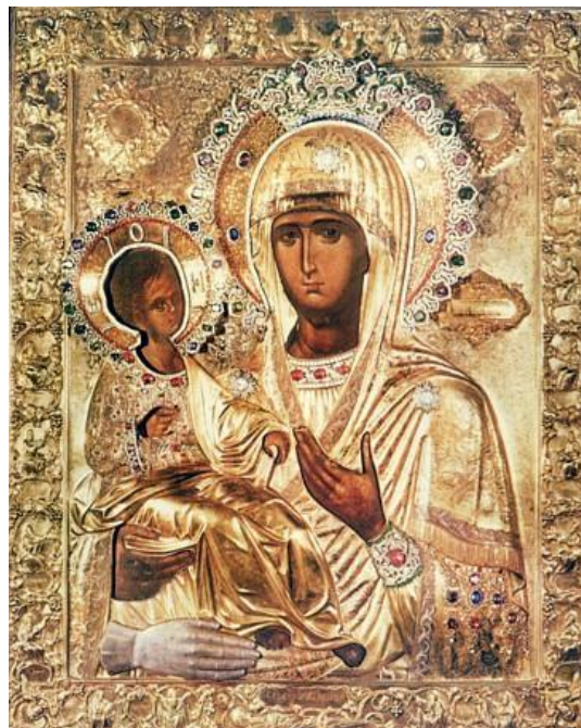
Рисунок 5. Оригинал иконы

Мой интерес разгорелся ещё больше. С чем связано такое различие? Какую историю хранит икона с таким необычным названием? Эти вопросы заставили меня продолжить исследование.