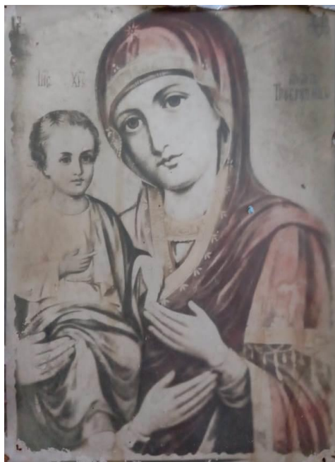
Рисунок 2. Фото иконы

Я часто бывал в гостях у бабушки и видел икону Божьей матери, стоящую на полочке и покрытую рушником, но никогда не подходил к ней близко. Решив рассмотреть икону поближе и, увидев такое вот изображение, я испытал удивление. Ведь на иконе у Богородицы три руки (рисунок 2)!