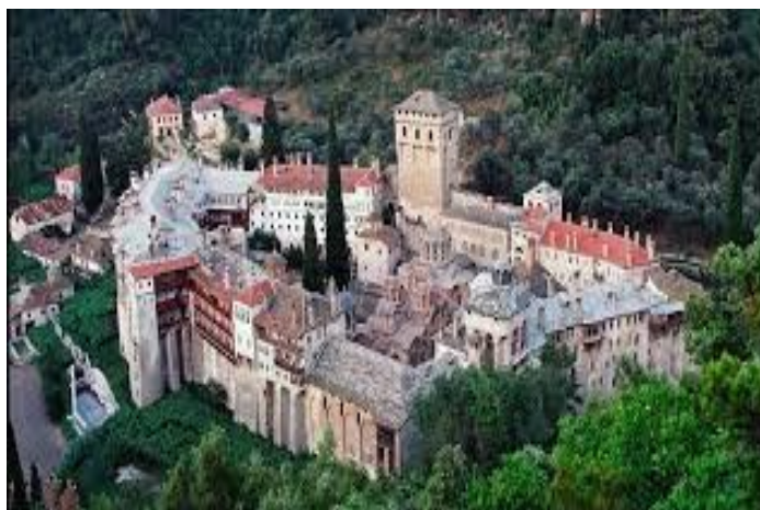
Рисунок 3. Монастырь Хиландар на святой горе Афон

Что бы это значило? И здесь есть три варианта – спросить у бабушки, полезть в специальную литературу или выдумать свою собственную версию, в зависимости от фантазии. Я решил действовать наверняка, и обратился к интернет-источникам. И вот что я узнал. Оригинал иконы хранится в монастыре Хиландар на святой горе Афон в Греции (рисунок 3).