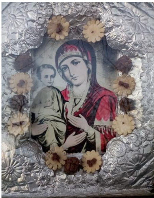
Рисунок 4. Бабушкина икона

Я сравнил изображение на бабушкиной иконе (рисунок 4) с оригиналом, и увидел существенное различие: «третья» рука не написана, а изготовлена из металла и наложена на поверхность образа (рисунок 5).