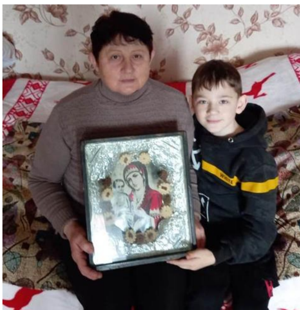
Рисунок 1. Икона нашей семьи

Каждая семья хранит какую-нибудь вещь (а может, и не одну), которая передаётся из поколения в поколение. Старинные часы, фотоаппарат, детская игрушка, столовая посуда, патефон – да мало ли предметов, которые мы храним как память, как реликвию о дорогих сердцу людях [3]. Ведь мы живём и сильны, пока цела нить, связывающая прошлое и настоящее. Вот и наша, как оказалось, семейная реликвия – икона - появилась в нашей семье очень давно, сопровождает нас на протяжении нескольких поколений. Она большая, старинная, ей больше ста лет (рисунок 1).